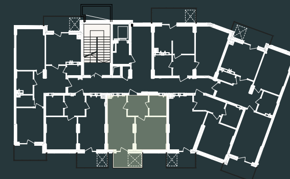
Схема розташування на поверсі