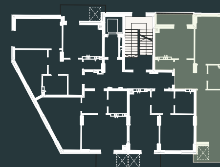
Схема розташування на поверсі