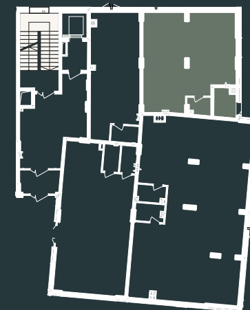
Схема розташування на поверсі